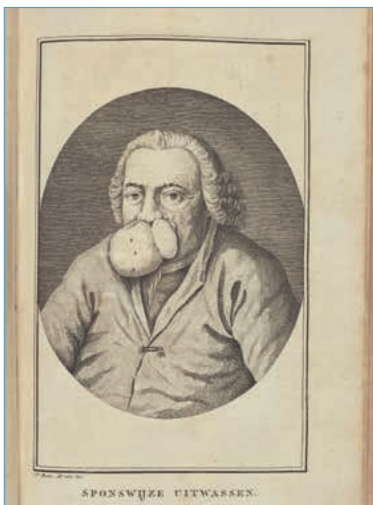
Figuur 1. Een patiënt met een extreme vorm van rhinophyma.

meerendeels, bedekt. --- Uit de nevensgaande Afbeelding, welke, kort voor de Operatie, naar 't leven is gemaakt, kan men het best van dit geval, schoon de kleine Gezwellen niet geheel te zien zyn, oordeelen.