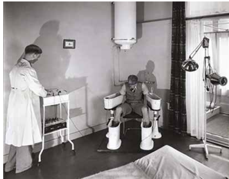
Afbeelding 4: Voorbeeld van fysische techniekbehandeling: elektrotherapie met een cellenbad in de jaren zestig van de vorige eeuw.