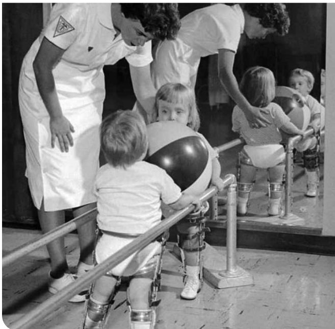
Afbeelding 3: Heilgymnastiek in de jaren dertig: een heilgymnaste oefent met kinderen in de loopbrug.