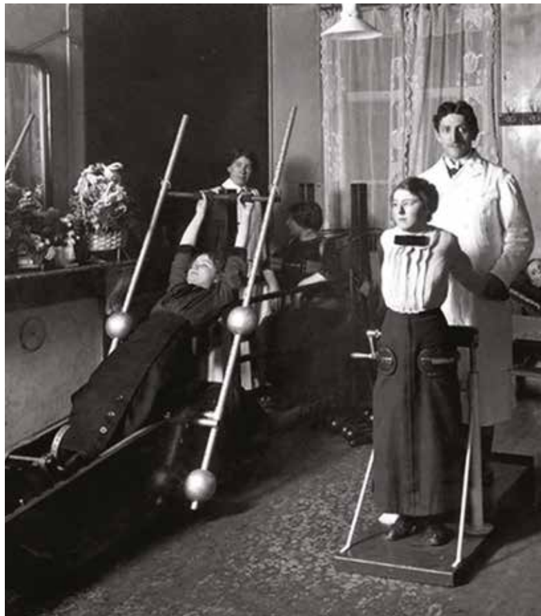
Afbeelding 2: Heilgymnastiek was rond 1900 sterk gericht op ruggegraatskrommingen.