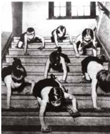
Afbeelding 5: Das Klappsche Kriechverfahren: specifieke kruipoefentherapie om ruggegraatsverkrummingen (scoliose) te bestrijden.