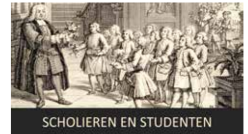
SCHOLIEREN EN STUDENTEN