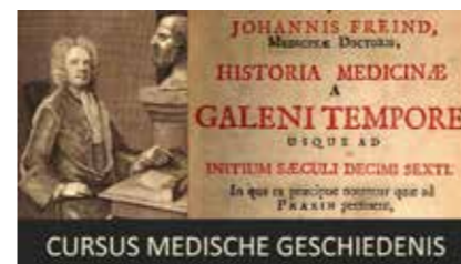
CURSUS MEDISCHE GESCHIEDENIS