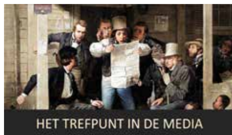
HET TREFPUNT IN DE MEDIA

Het Trefpunt staat midden in het werkveld van de medische geschiedenis in Nederland. Door zijn omvangrijke bibliotheek, uitgebreide erfgoed collecties en connecties met de medische beroepsorganisaties en specialismen, de verpleegkunde, de paramedische vakken, de farmacie, de tandheelkunde, de diergeneeskunde en gezondheidszorginstellingen en -organisaties biedt het een creatieve werk- en overlegomgeving voor iedereen die geïnteresseerd is in de medische geschiedenis. Studenten uit het hoger en middelbaar onderwijs kunnen in het Trefpunt terecht voor hulp bij de voorbereiding van een medisch-historische presentatie en het schrijven van scripties.