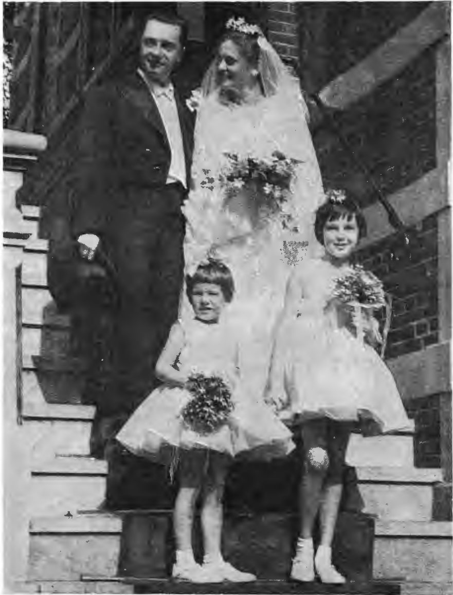
Het bruidspaar op de stoep van het gemeentehuis te Bussum

In de geest van Albert Schweitzer gaan zij in het Zuiden van Frankrijk een centrum vestigen op het platteland voor ontheemden en vluchtelingen, voor verlaten en verwaarloosde kinderen. Zij willen trachten om iedere familie een eigen woning, een eigen thuis te geven, waar het persoonlijke leven tot zijn recht kan komen. Het werk zal op coöperatieve basis verricht worden. Het zal bestaan uit: landbouw, groenteteelt, fruitteelt, veeteelt, bebossing, viskwekerij, nuttige en artistieke handenarbeid.