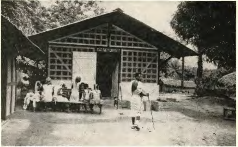
Case Gretha Lagerveldt

een heerlijke wandeling. Door het hoge gras en tussen struikgewas door volgden we een smal paadje, dat naar een maniokplantage leidde. Heuvel op heuvel af, ook door een moerasje moesten we, waar je op een dun boomstammetje doorheen moest balanceren. Maar mijn zwarte begeleider liep op zijn blote voeten naast me door 't water en zo kon ik veilig en met droge voeten aan de overkant komen.