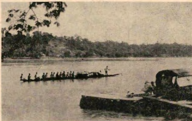
Af en toe varen pirogues voorbij met staande of zittende pagageurs

met een rhythmisch trommelgeluid, dat steeds sneller gaat tot een heel vlugge roffel. Dan houdt het een paar minuten op... en begint weer opnieuw. Achter mij klinkt af en toe: „Bonsoir mademoiselle". Dan loopt een of andere bekende langs om zich te gaan wassen of water te halen. Je hebt er geen idee van, hoe mooi het staat als ze de dingen op het hoofd dragen: een vrouw met een veelkleurige doek om met een emmer, of een pak met bananen of