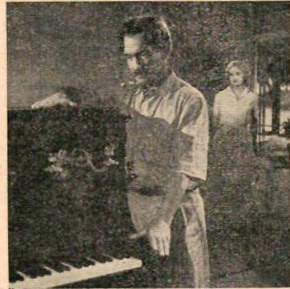
Pierre Fresnay als Albert Schweitzer

begint in 1912, het tijdstip, waarop de reeds vermaarde theoloog, wijsgeer en musicus al deze verworvenheden vrijwillig prijs geeft, om als nederig medisch student een nieuwe roeping te volgen. Een toevallig opgevangen bericht over de verschrikkelijke hygiënische toestanden in Frans Aequatoriaal Afrika heeft hem tot dit besluit gebracht. Zijn taak (zo weet hij) ligt in het verre Lambarene, waar noden te lenigen zijn, die ieder voorstellingsvermogen te boven gaan. Hij behaalt zijn doktersgraad en vertrekt naar de Franse kolonie, slechts vergezeld door een jonge verpleegster, die om overigens strikt persoonlijke redenen) bereid is zijn zelfgekozen ballingschap te delen.