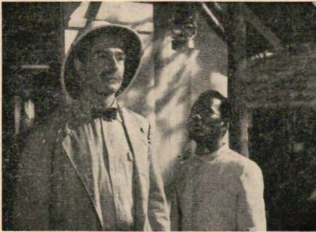
Pierre Fresnay gaf een prachtige creatie van Albert Schweitzer

stellen. Men protesteert wanneer het drama al te vrijmoedig omspringt met de historische feiten en zelfs onjuistheden in sfeer, stijl en milieu passeren niet langer ongestraft het kritisch oog. Maar bewust of onbewust doet zich daarbij steeds nadrukkelijker het verlangen gelden, in de historische gestalte tevens het levende personage te herkennen..... vlees van ons vlees, bloed van ons bloed. Het historische portret als fotografische reproductie, met bijbehorende feiten, data en geschiedkundige frasen, voldóet ons niet meer. Wij vragen niet langer in de eerste plaats „WAT was deze mens?“, maar „WIE was deze mens?“