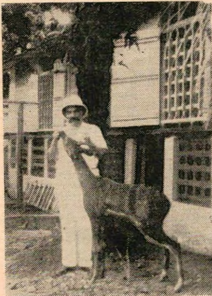
Albert Schweitzer bij z'n antilope

Deze manier van jagen werd verlaten, toen de mensen in de tijd van de verlichting begonnen na te denken en het wrede niet alleen van de marteling, maar ook nog van zoveel van andere,