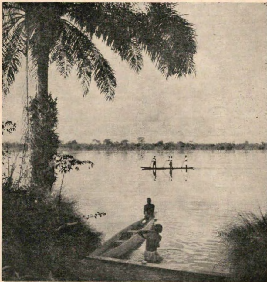
Op de Ogowe

Verschijnt eens per kwartaal en wordt aan de geadresseerden gratis toegezonden Redactie-adres: D. A. Werner, Henegouwerlaan 50b, Rotterdam, tel. 50106, postrek. 14832 Administratie: Uitgeverij „De Torenlaan“, aan de Torenlaan 20 te Assen, telef. 3044 (3 lijnen)