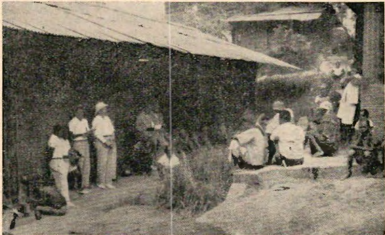
Dr. Schweitzer staat voor de case Pahouin met aan elke kant een tolk