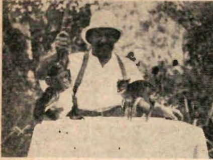
Albert Schweitzer met zijn dierenvriendjes

Ik wil, lezers, graag wat schrijven over de dieren hier, waarvan je evenveel merkt als de mensen.