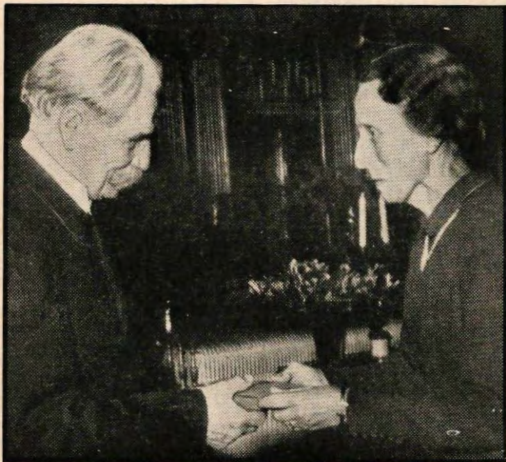
Tijdens zijn jongste verblijf in Zweden.

In Parijs is gereed gekomen de film: „Il est minuit, Dr. Schweitzer", waarin Pierre Fresnay de rol van Albert