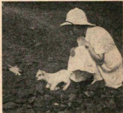
Zuster Ali met een jong geitje