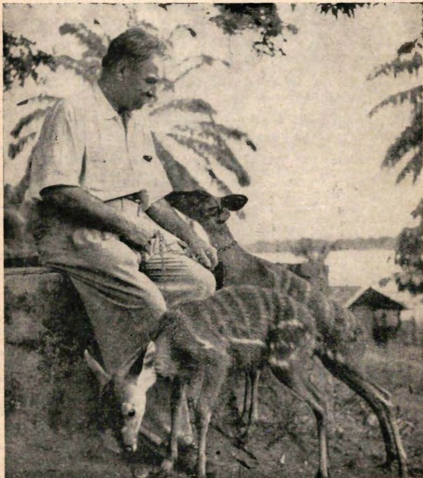
Albert Schweitzer met zijn lievelingsantilopen .