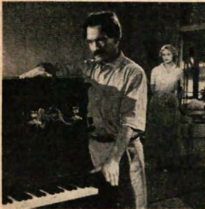
Pierre Fresnay als Albert Schweitzer

Schweitzer vertolkt. De première van deze film wordt in Januari in het Kriterion theater te Amsterdam verwacht.