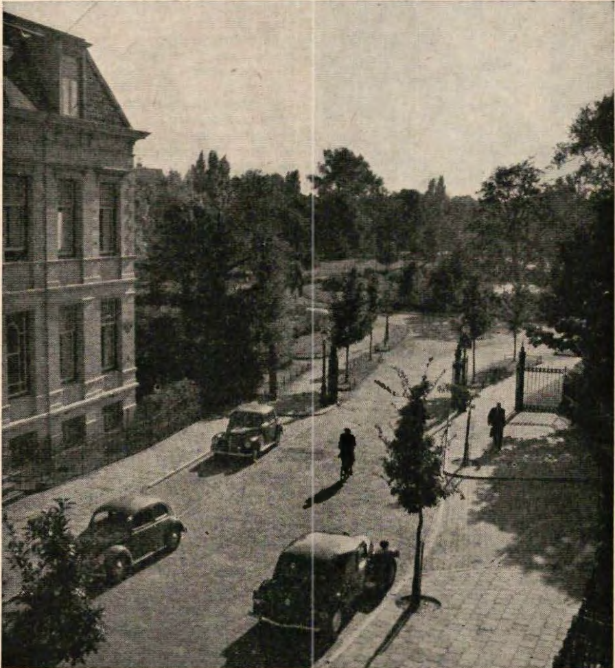
Aan de Roemer Visscherstraat 46 te Amsterdam werd 23 November 1951 het Albert Schweitzerhuis geopend. De mooie ruime suite geeft uitzicht op het Vondelpark