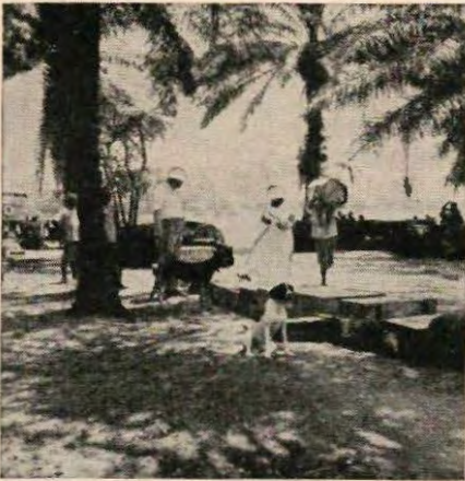
Albert Schweitzer registreert de aangekomen goederen

Duizenden kwamen er om genezing te vinden, en hopelijk zullen nog duizenden de weg naar het hospitaal kunnen vinden.