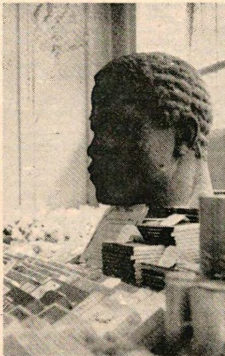
Wat er van het monument overbleef prijkte in de etalage van een patisserie

Overgenomen uit het Remonstrants Weekblad.