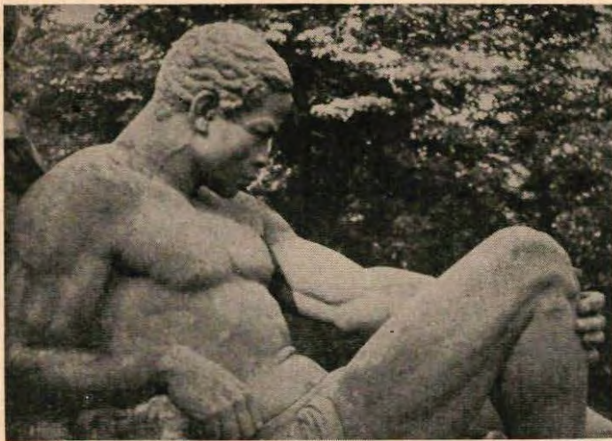
De negerfiguur aan de voet van het standbeeld van admiraal Bruat te Colmar, symbool van het zwarte wereldrijk