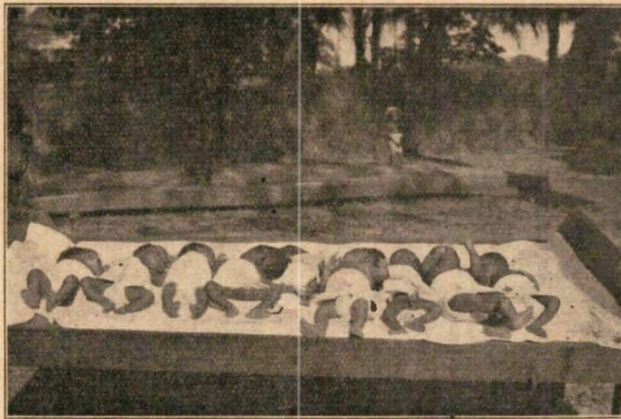
Neger-zuigelingen, in het Ziekenhuis geboren.

Ongeveer 4 uren duurt het, eer de 300 zieken en hun begeleiders aan de artsen en verpleegsters voorbijgegaan zijn. Iedere haast bij het houden van het appèl is uit den boze. Rustig worden alle vragen, die er ten opzichte van een gast van het ziekenhuis rijzen, tussen artsen en verpleegsters besproken. Het gaat over diagnose en verpleging