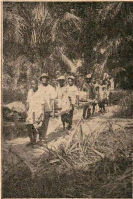
Uit het woud wordt brandstof voor het Ziekenhuis thuis gebracht.

Van 1—2 uur moeten de artsen en verpleegsters rusten, om weer fris te zijn voor het werk van de namiddag. Aan de aequator is zo'n siesta zeker noodzakelijk. Van twee uur of houden de artsen zich bezig met de mensen, die voor consultatie of voor opname kwamen, voorzover zij 's morgens niet geholpen konden worden.