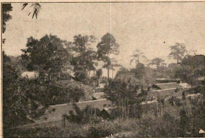
Gezicht van uit onze woning op de lange reeks van daken der ziekenbarakken. Op de achtergrond de rivier.