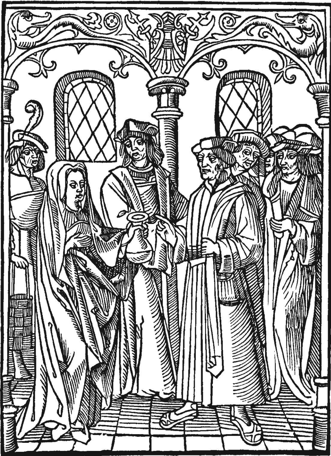
Die judicien der urinen. Houtsnede uit Fasciculus medicine, Antwerpen bi Claes die Graue in onser vrouwe(n) pant. 1512. f o .